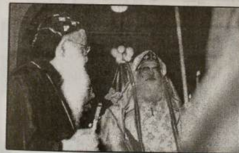
നിയുക്ത കാതോലിക്ക കഥാപുരുഷന്റെ ഭൗതിക ശരീരത്തിനു മുമ്പിൽ