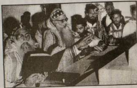
ത്യസ്സർ ചെമ്പുക്കാവ് സെന്റ് തോമസ് പള്ളിയുടെ കുദാശ. ഹാലേ.....ലു.....യാ..... (വിശുദ്ധ മുരോൻ അഭിഷേകം)