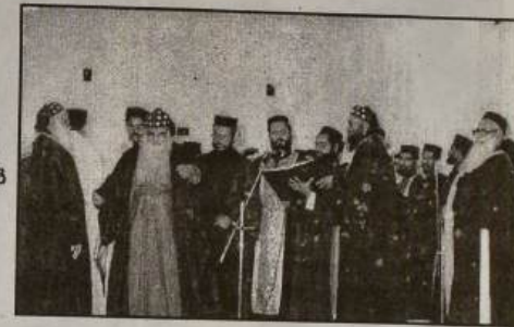
പുതുക്കിപ്പണിത കൊരട്ടി അരമന ചാപ്പലിന്റെ കുദാശ. പ്രധാനഭാഗങ്ങൾക്കു ശേഷം കഥാപുരുഷൻ “അവസാനമായി” മദംബഹായോട് വിടപൊല്ലുന്നു.