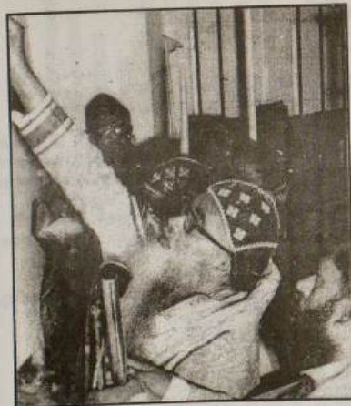
“ബാറെക് ഉകാദേശ്.....” ദേവാലയത്തിന്റെ കിഴക്കേ ഭിത്തി മുദ്രണം ചെയ്യുന്നു.