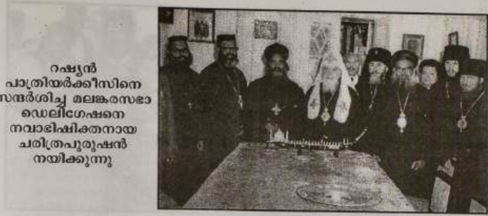
റഷ്യൻ പാത്രിയർക്കീസിനെ സന്ദർശിച്ച മലങ്കരസഭാ ഡെലിഗേഷനെ നവാഭിഷിക്തനായ ചരിത്രപുരുഷൻ നയിക്കുന്നു