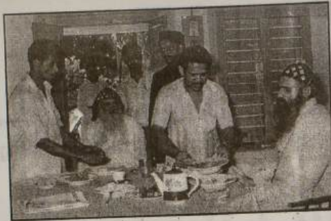
മെത്രാസന വിഭജനത്തിന് ശേഷം കുന്നംകുളത്തിന്റെ പാലൂസ് മാർ മിലിത്തിയോസ് മെത്രാപ്പോലീത്തായുടെ മൊത്തം